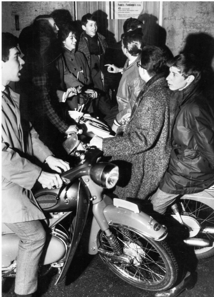
Nozems op hun brommertjes.

Het onderzoek voor zijn boek heeft de schrijver veel plezier bezorgd. „De provo's heb ik helaas gemist, maar het eind van die hele vrijheidsbeweging heb ik wel mee gekregen. Ik heb in 1969 ook 'Johnson Molenaar' lopen schreeuwen tegen de oorlog in Vietnam; 'Johnson moordenaar' mocht niet. Ik vond dat 'molenaar' echt een vondst. De krakersrellen in de Hondstraat, het Huis met de Strik; daar was ik bij, met een camera, want ik deed een fotocursus. Werd ook niet rust gelaten door de politie, haha! Ik ben verliefd op de provo's, maar