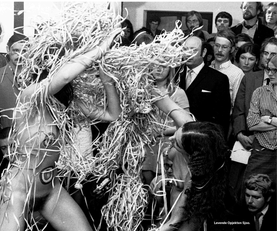
Levende Opjekten Sjoo.

Jekerkwartierbewoners van die tijd. Het nu zo fraaie Jekerkwartier was tot medio jaren 70 een krotterwijk met zeker in het hart veel 'mensenpakhuisen' die de gemeente volledig links liet liggen. Een vrijstaat waar het verzet tegen de gevestigde orde werd geboren. Zo rukken op 21 april 1966 tweehonderd jongeren van café Petit Tanneur op naar het beeldje van de Mestreechter Geis op de kop van de Stokstraat. Ze noemen zich provo's en maken zich op voor een 'happening', analoog aan de 'happenings' bij het Lieverdje in Amsterdam.