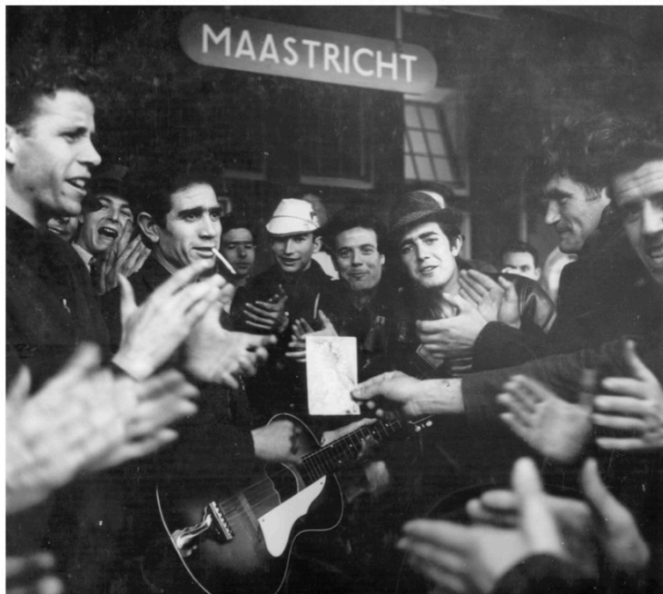
Spaanse gasarbeiders op het station.

REAGEREN? anneles.hendriks@delimburger.nl